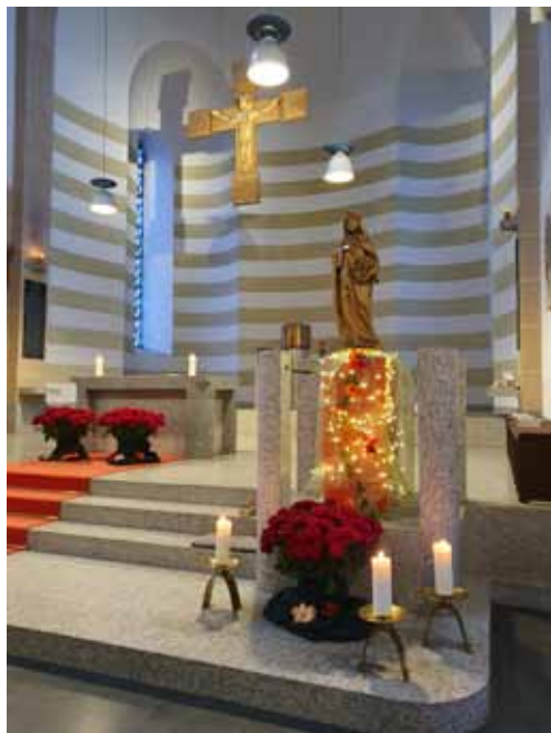
Eine schöne Feier zum Patrozinium der Hl. Elisabeth.