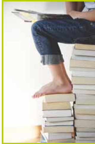
Die Büchereien für alle.

Ihr Bücherei-Team der Bücherei Liebfrauen