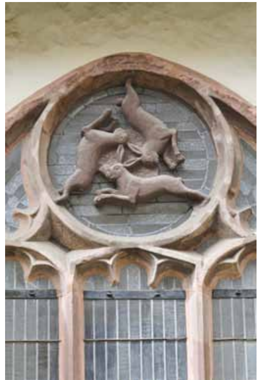
Das Dreihasenfenster in Paderborn