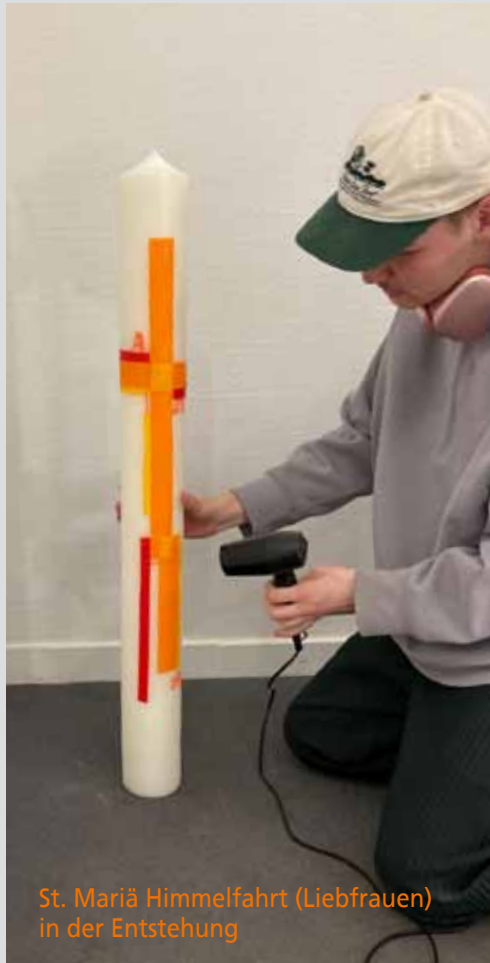
St. Mariä Himmelfahrt (Liebfrauen) in der Entstehung