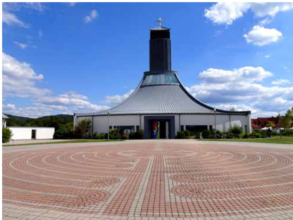
Autobahnkirche Himmelskron mit Labyrinth an der A9 Bild: Friedbert Simon; In: Pfarrbriefservice.de

Pressemitteilung DBK; In: Pfarrbriefservice.de