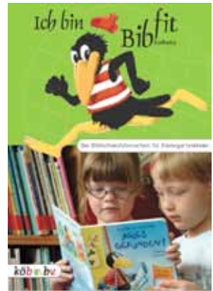
Bücherei St. Paulus

Malaktion hat Fridolin neue „Kleider“ bekommen. Zum Schluss konnte jedes Kind seine bibfit-Urkunde mitnehmen. Herzlichen Glückwunsch! – Es hat uns viel Spaß gemacht.