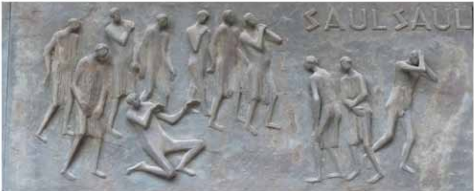
25. Januar: Fest der Bekehrung des Paulus

Bekehrung ist immer Eingriff von außen. Gott ist am Werk.