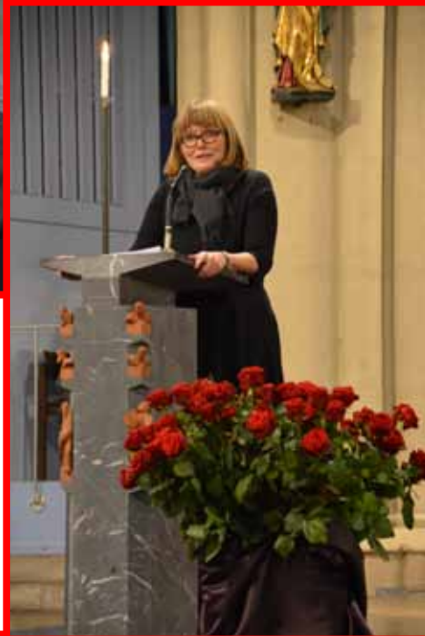
Vesper-Predigt: Bürgermeisterin Klaudia Zepunkte